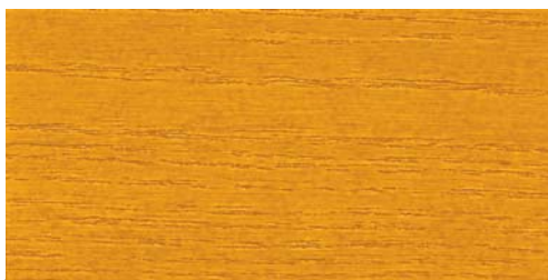
2335 pinie / kiefer