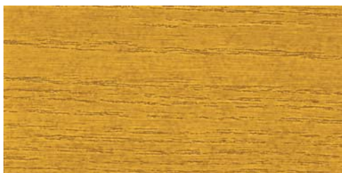
6570 eiche hell