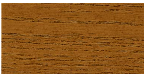
8260 eiche antik